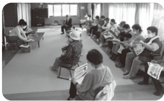
10/26 前平地区 出前講座

の手法を再現した映像を持参されたパソコンにて流していたいただき、より現実味があり、参加さ