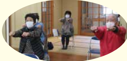
～樋合・永浦なでしこ会 体操風景～