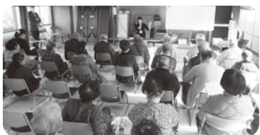
マイナンバー制度について