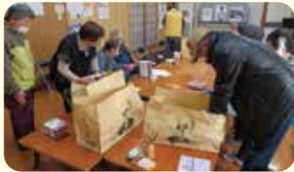
～「おこわ配り」の準備中～

老人会でも居場所づくりをはじめ、地域との繋がりを大切にした活動がされており、皆さんの笑顔や言葉に心がポカポカ温まる時間を過ごすことができました。