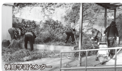
樋島学習センター

11月4日から6日に上天草市内8か所にて、上天草市ボランティア連絡協議会で清掃ボランティア活動を行いました。ゴミ拾いや落葉拾い、窓拭き等を行いました。延べ118人の方が地域美化のために汗を流しました。