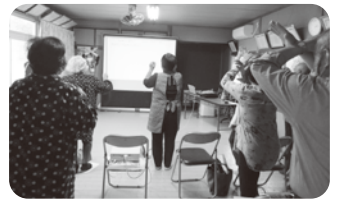
10/27 堤地区 出前講座