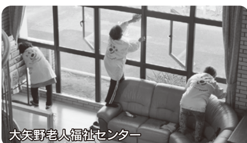
大矢野老人福祉センター