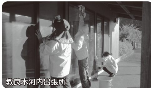
教良木河内出張所