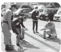
11/27 江後地区出前講座 消火訓練の様子

消防署の方からは火災報知器についての説明がありました。講話が終わると、久しぶりに外で消火訓練を行い、参加者が実際に水消火器を使って火に見立てたスタンドを倒す訓練をすることが出来ました。参加された皆さん、集中力が途切れることなく最後まで話を聞いて帰られました。今後とも地域にあった出前講座などを活用しながら、それぞれの地域力を高めていただきたいと思います。