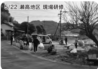
5/22 瀬高地区 現場研修