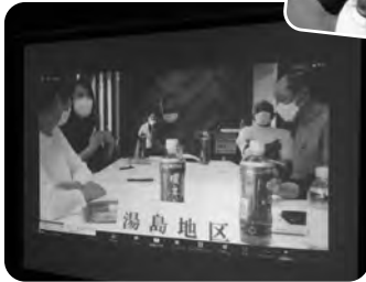
湯島地区の皆さんはリモート参加☆

少子化と共に昔と比べて地域で子ども達の姿を見かける機会が減り、未来ある子ども達と地域の関わり合いが希薄化している現状があります。今後は地域共生社会に向けた地域づくりの第一歩として、世代間交流のきっかけづくりを地域の皆さんと一緒に考えていきたいと思えます。