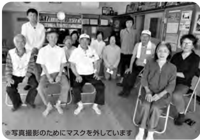
※写真撮影のためにマスクを外しています