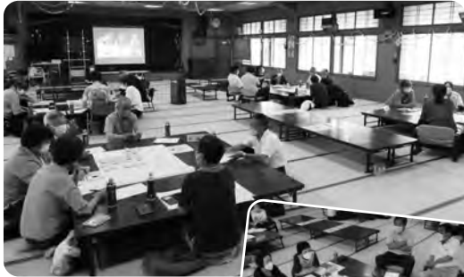
～おたっしや会の様子～