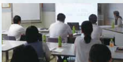
肥後銀行松島支店