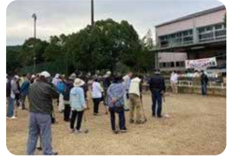
教良木河内地区社協