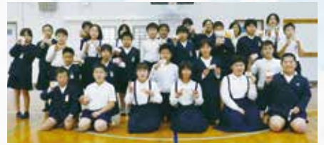
阿村小学校4・5年生