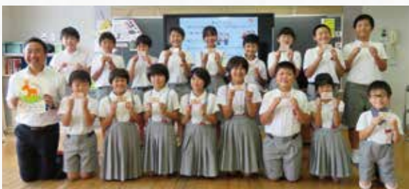
龍ヶ岳小学校4年生