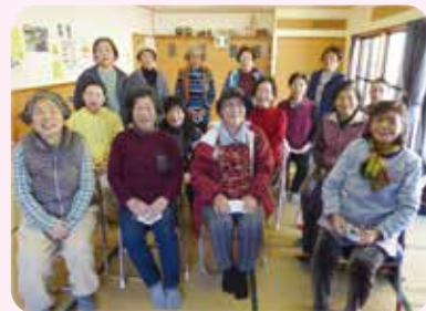
※写真撮影のためにマスクを外しています