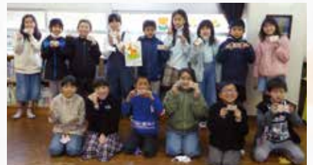
中北小学校3・4年生