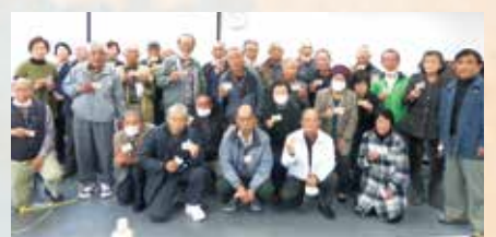
上天草老人会シルバーヘルパー養成講習会