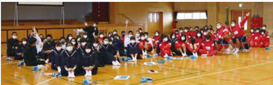
大矢野中学校2年生