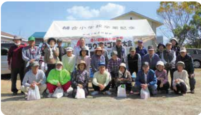
樋合永浦地区社協