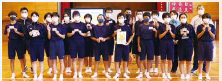
龍ヶ岳中学校2年生